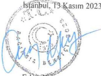
Erkut Yavuz Sorumlu Denetçi